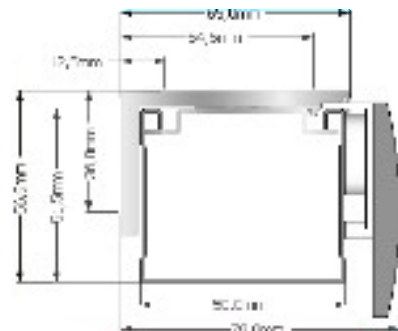
Voorbeeld 50 mm bovenbak

Afmetingen van alle bovenbakken vind je op de website